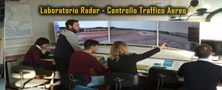
Laboratorio Radar - Controllo Traffico Aereo