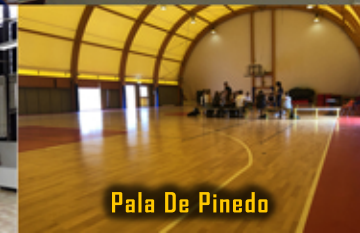
Pala De Pinedo