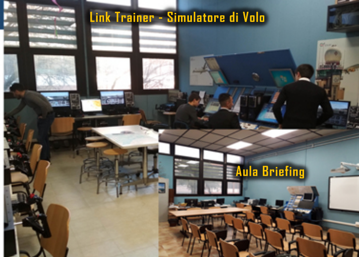
Link Trainer - Simulatore di Volo