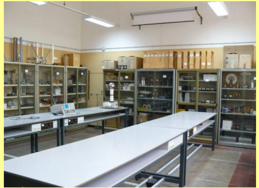
Laboratorio di Fisica