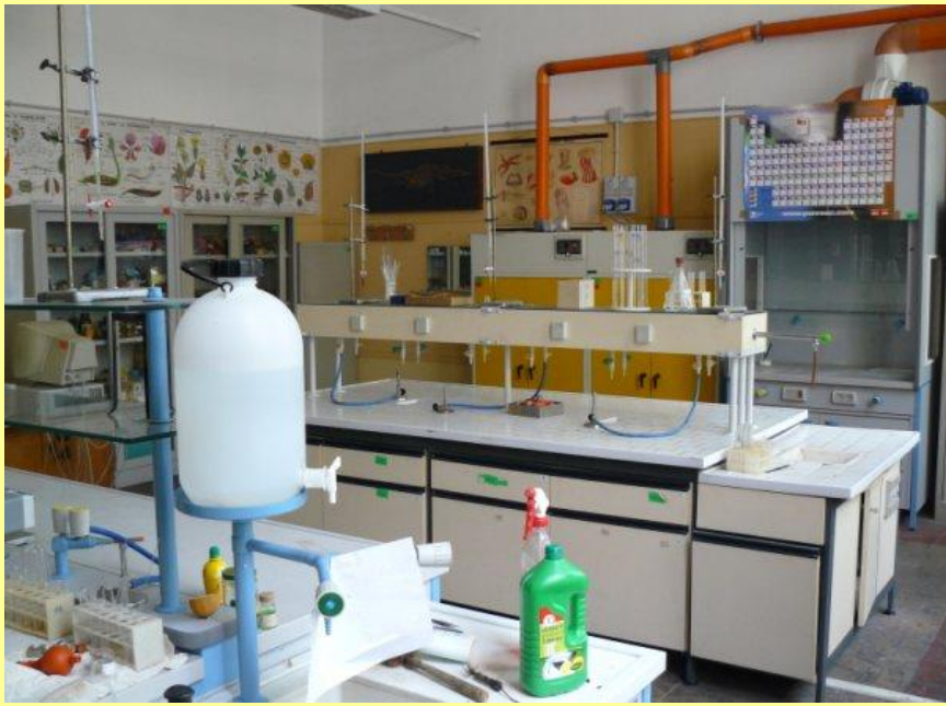
Laboratorio di Chimica