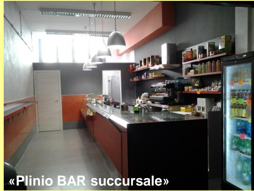
«Plinio BAR succursale»