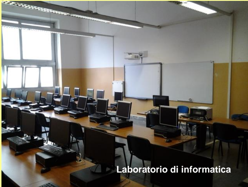
Laboratorio di informatica