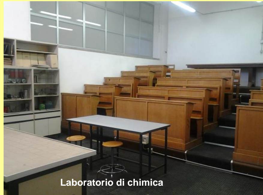
Laboratorio di chimica