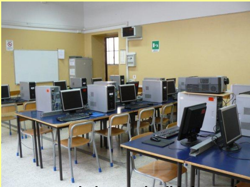
Laboratorio di informatica