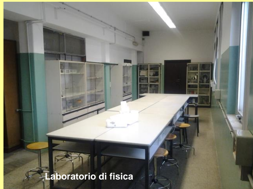
Laboratorio di fisica