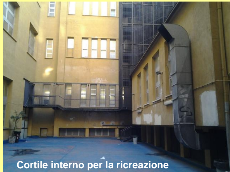
Cortile interno per la ricreazione